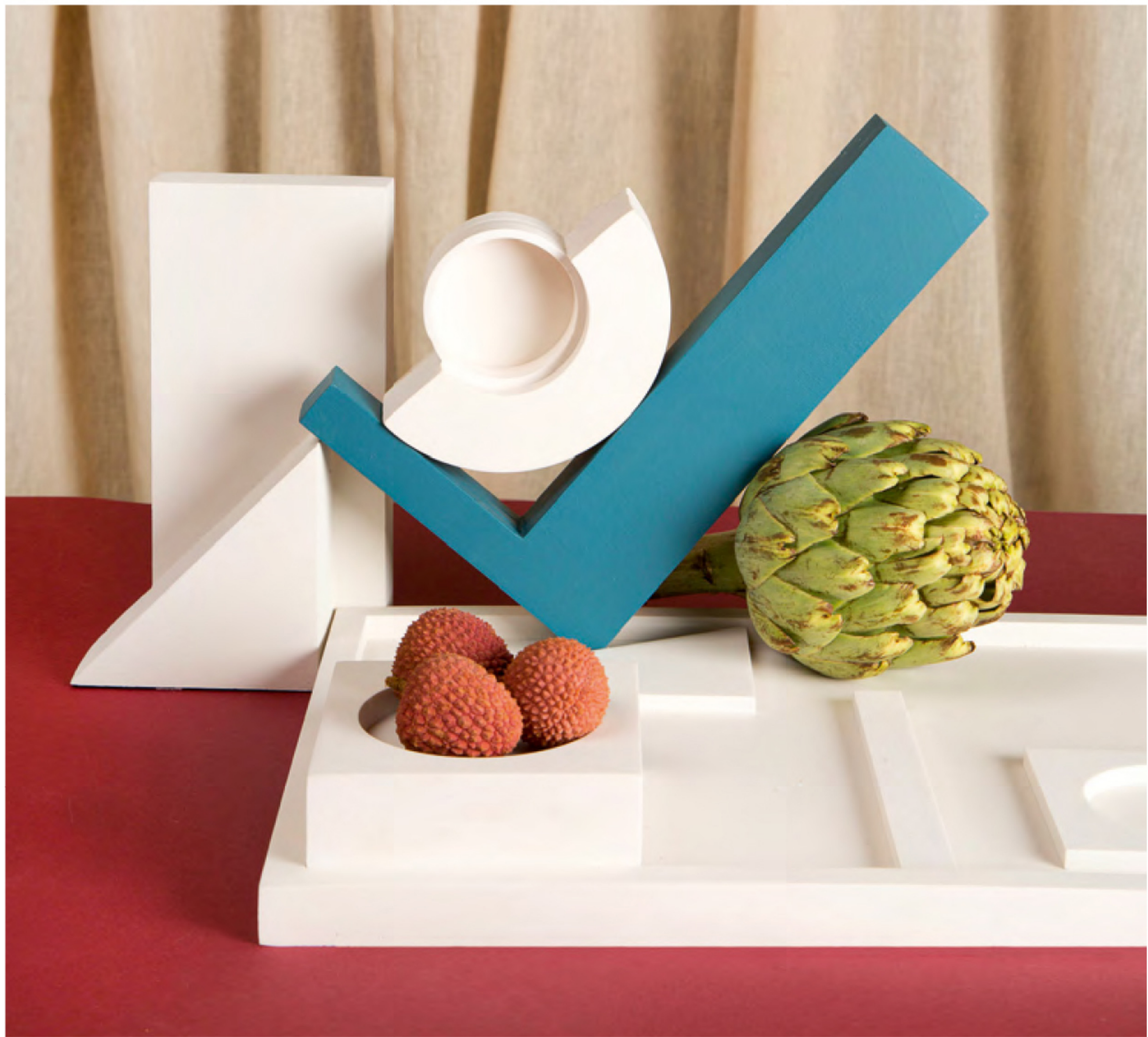
„Checkmark” (2019) – białe i niebieskie kształty geometryczne, które odwołują się do symboliki sukcesu i zwycięstwa.