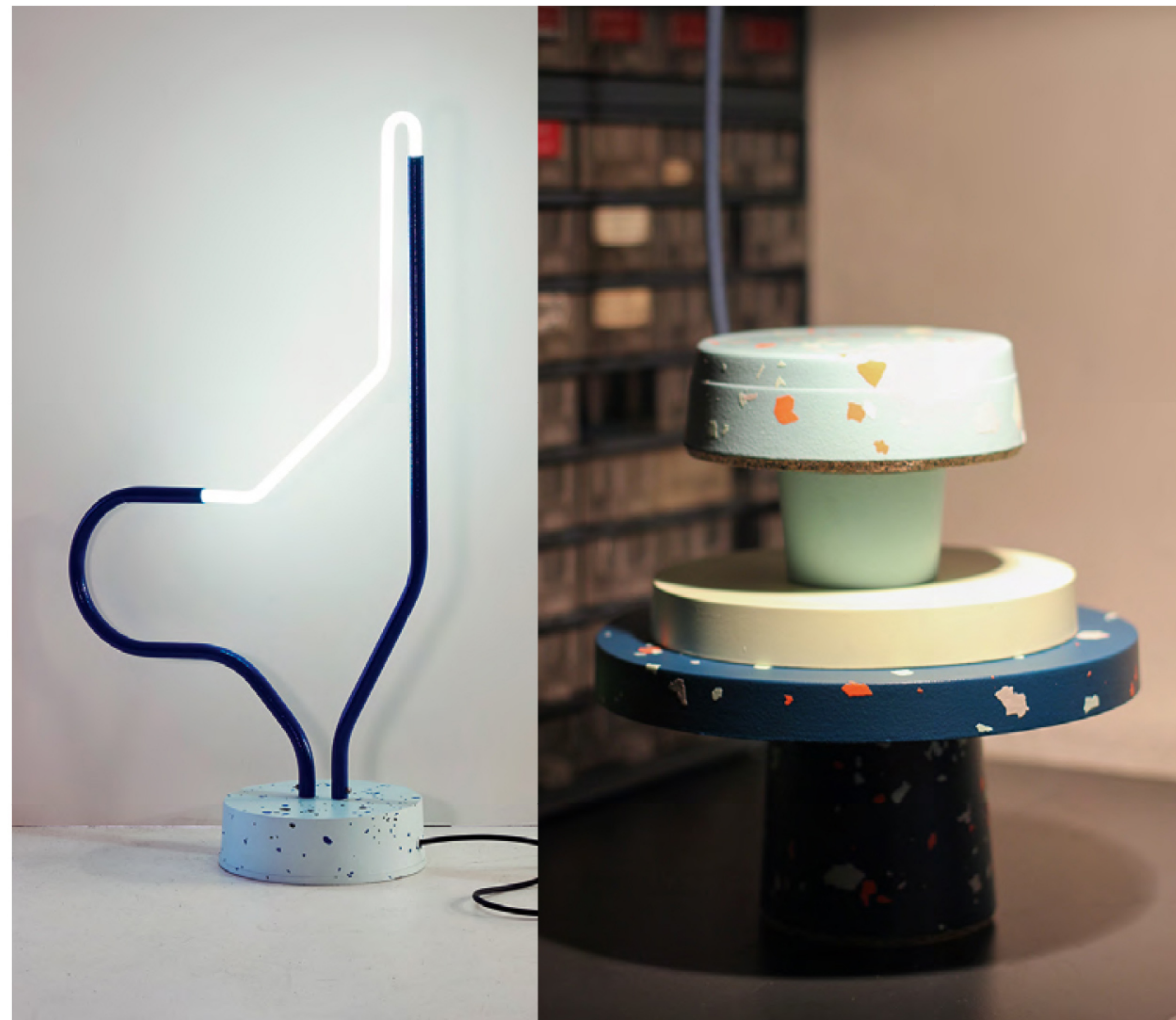
„Lampy „Blue” (2018) oraz „Multi-layered” (2019) – abstrakcyjne formy, które eksperymentują z kolorami i materiałami.