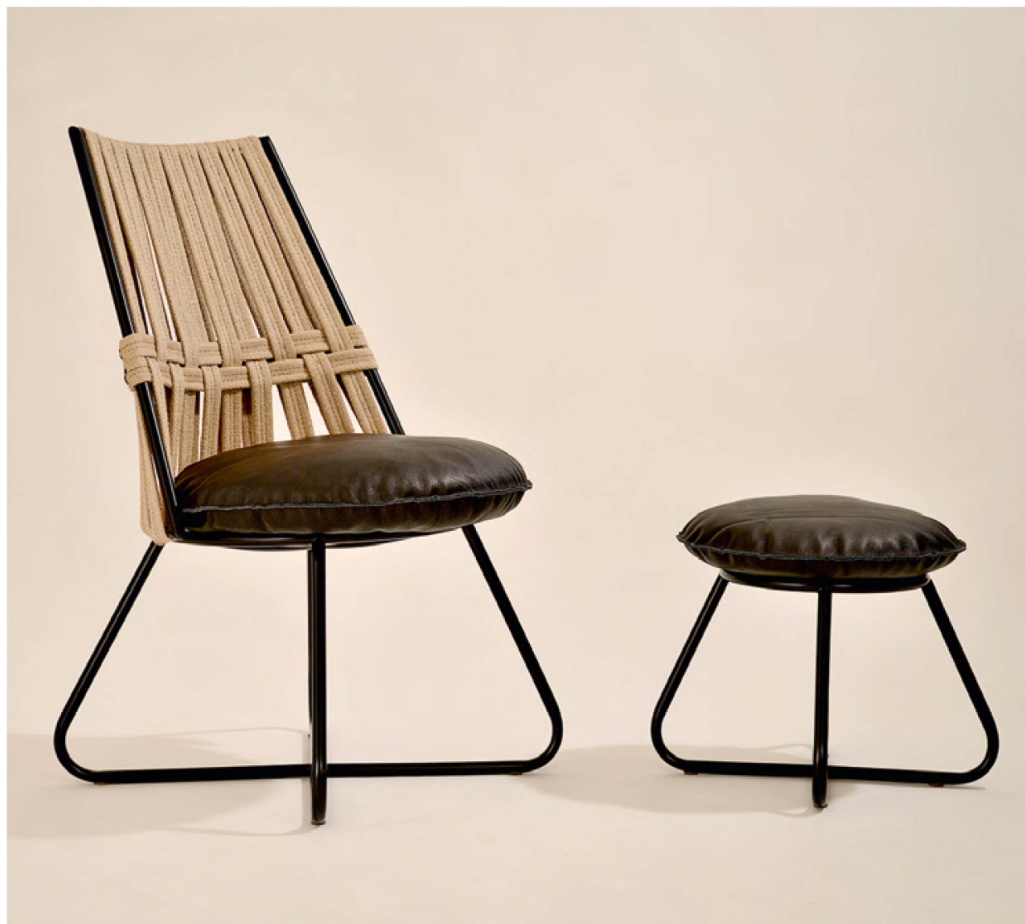
„KOLLEKT” to kolekcja projektowana i wykonana w Islandii. Erla Sólveig Óskarsdóttir, która w pełni projektuje i wykonuje meble.