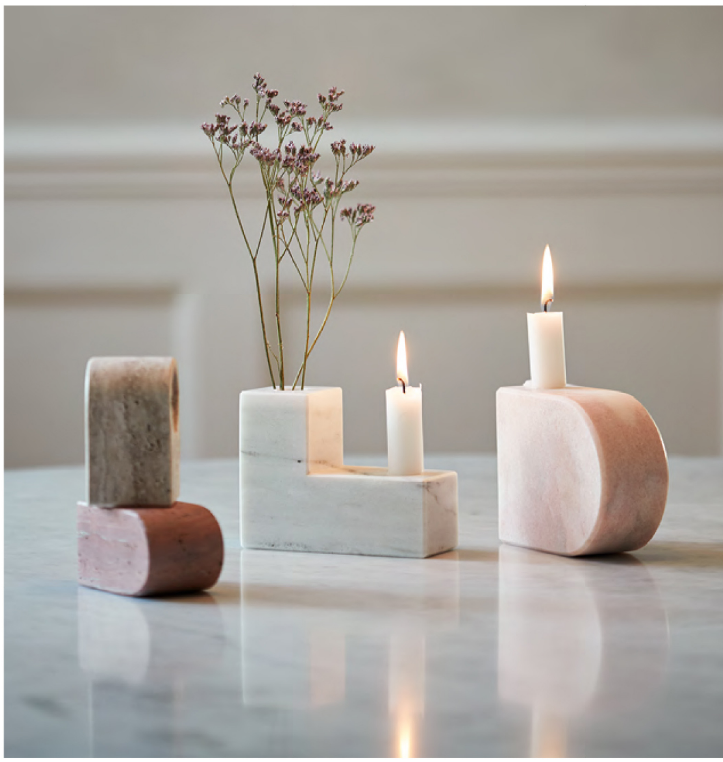
„The Living Object” – obiekt z wykorzystaniem odpadów i naturalnych materiałów.