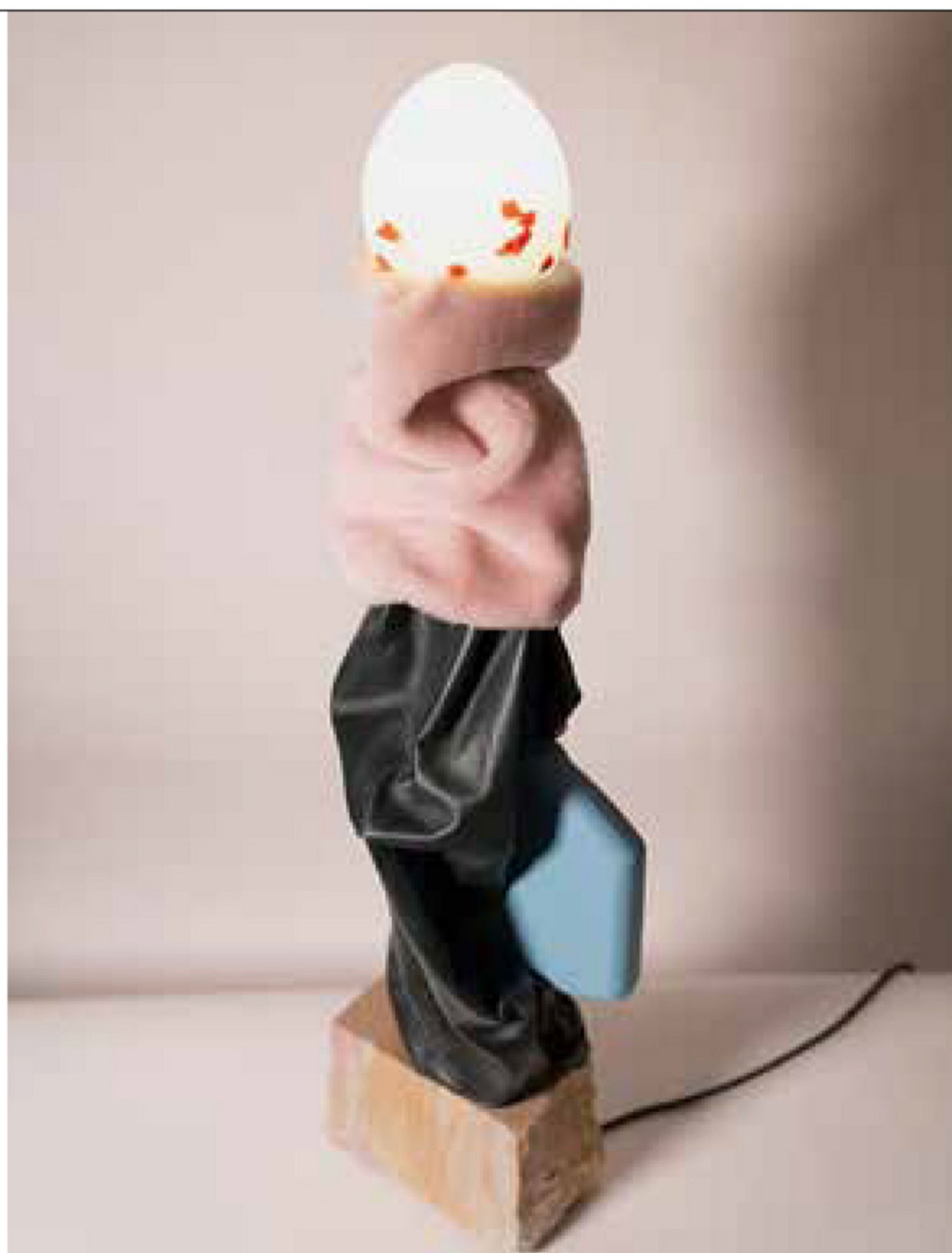
LAMPA „L.A.M.” składa się z podstawy wykonanej z faszki i lakierowanego marmuru, białego akrylu i tuby oraz szklanego klosza.