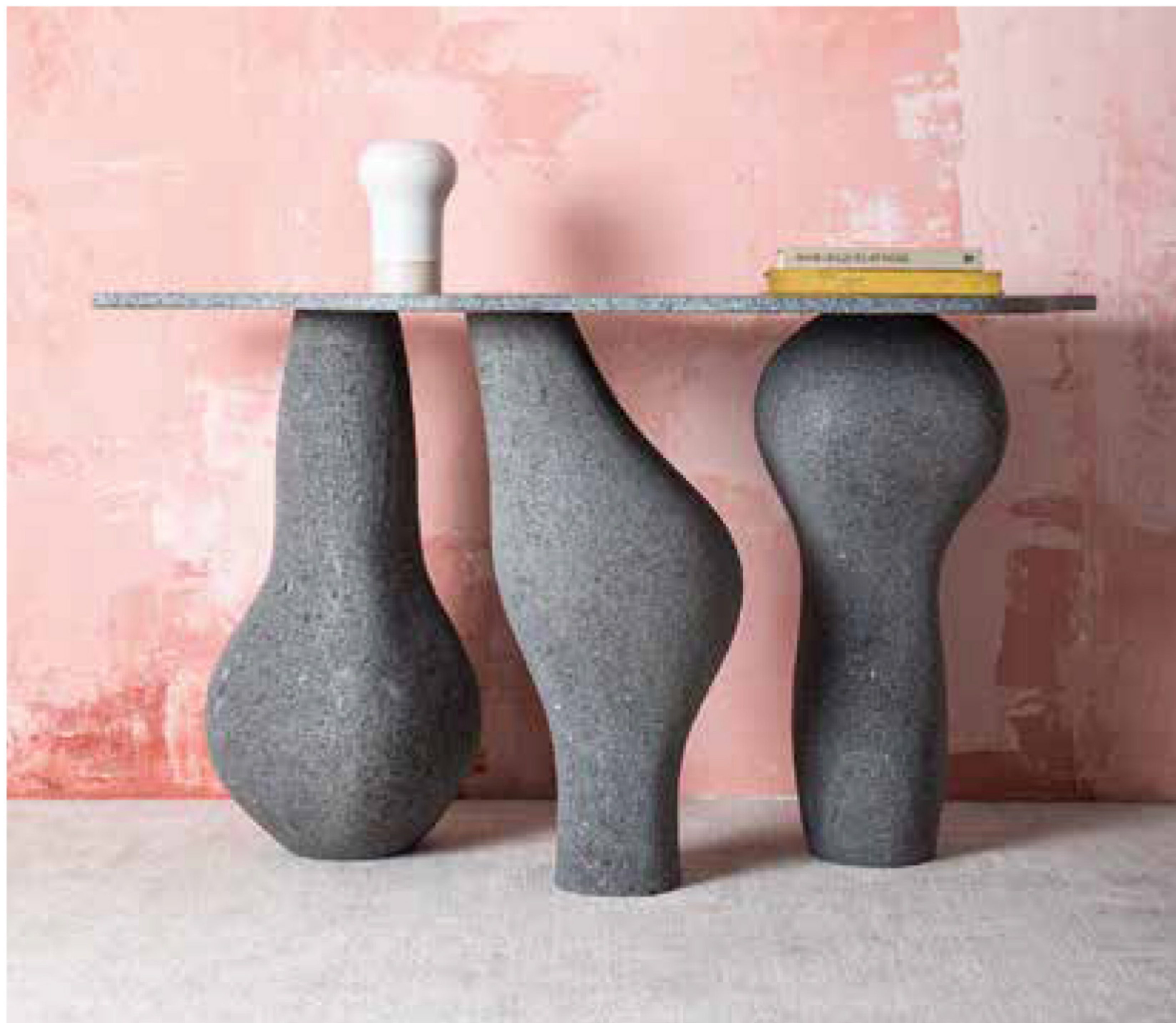
WISZĄCA „THE ACTOR” (ang. oferta), wykonana ze stali wulkanicznej, powstała z inspiracji meksykańskimi obiektami ceremonialnymi.