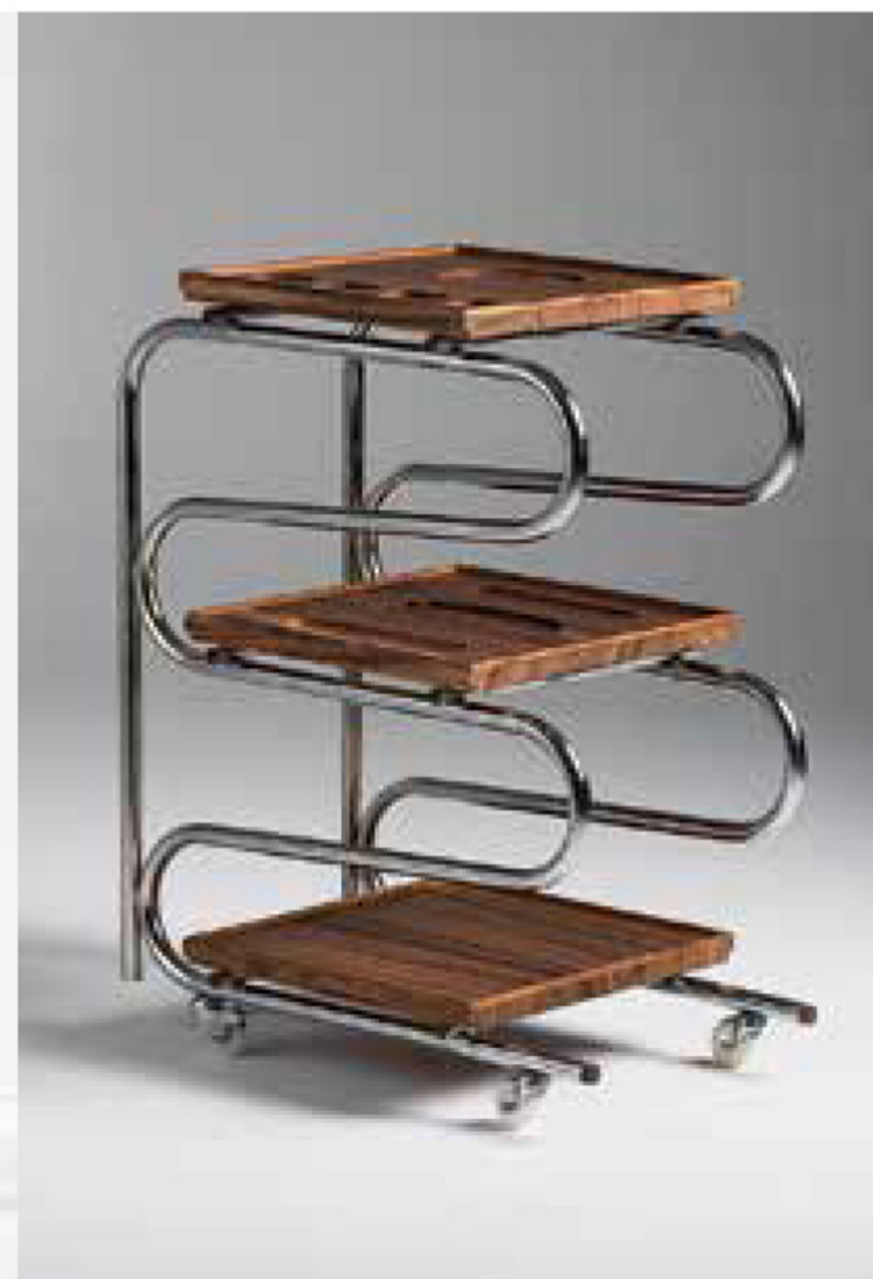
OBIEKT Z DRZEWIA I METALA to „Collectible design collection 2” projektu Marry Riondy. Po prawej: kuchenne wózki „The Sum of Small Parts”, który powstał z łapczywy do otwartej przeszłości w czasie pandemii.