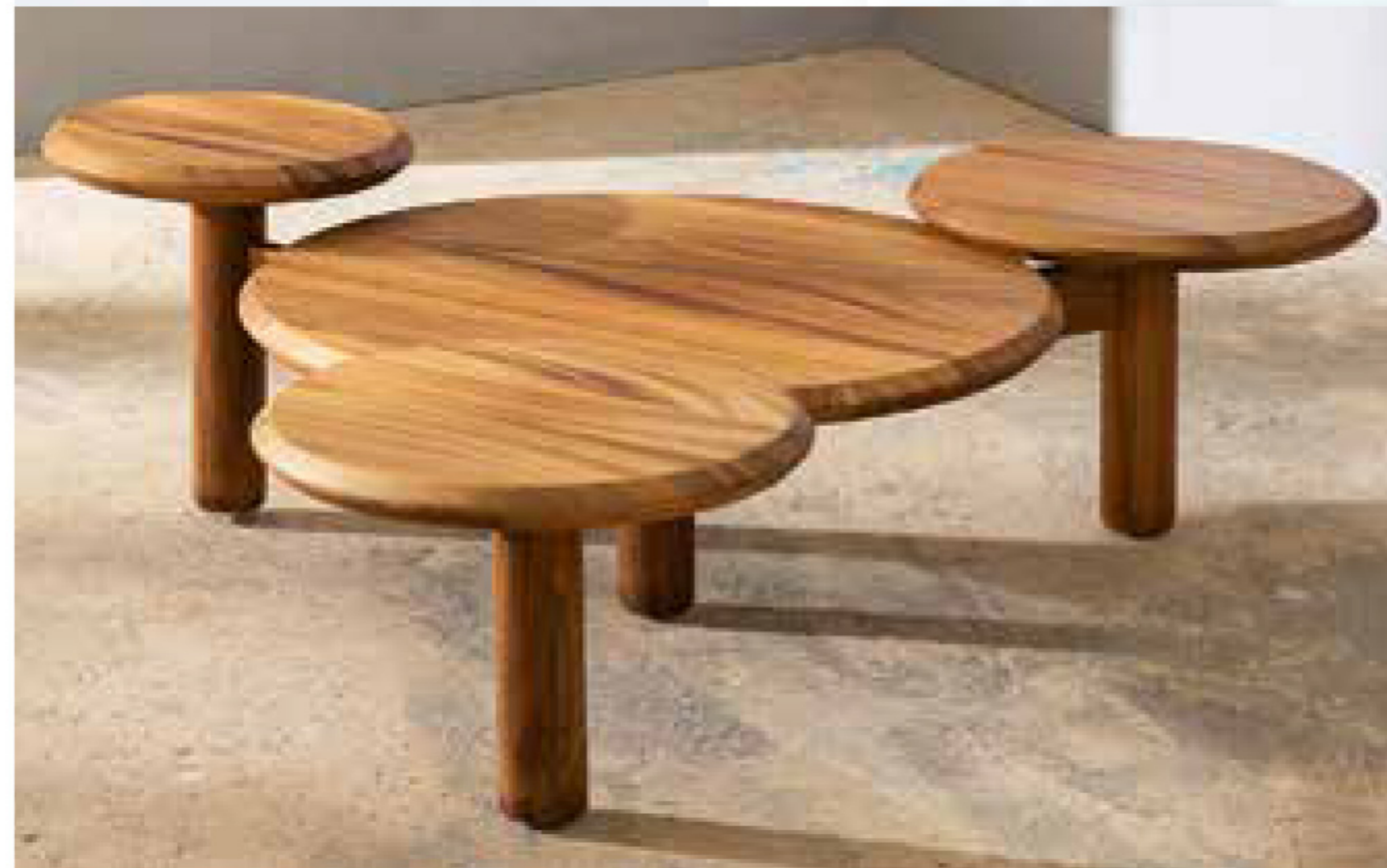
DO OMIĘSIENIA: ZABAWKI i wiszący stół pomieszczenia z kolekcji „Capuchin”. Ponadto stół kawowy z serii „Dama”, inspirowany żółtą zabawką używaną do smażenia tortów.